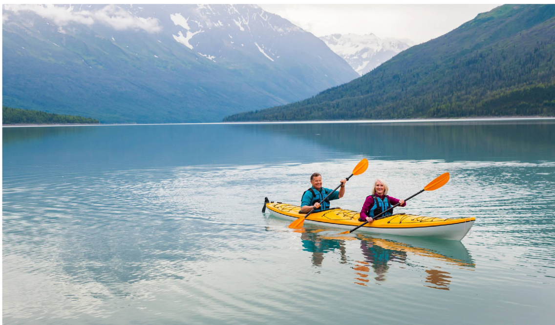
Im Kajak über den Urnersee zu fahren, macht Spass und hält fit.

Telefon 041 810 32 27 www.sz.pro-senectute.ch