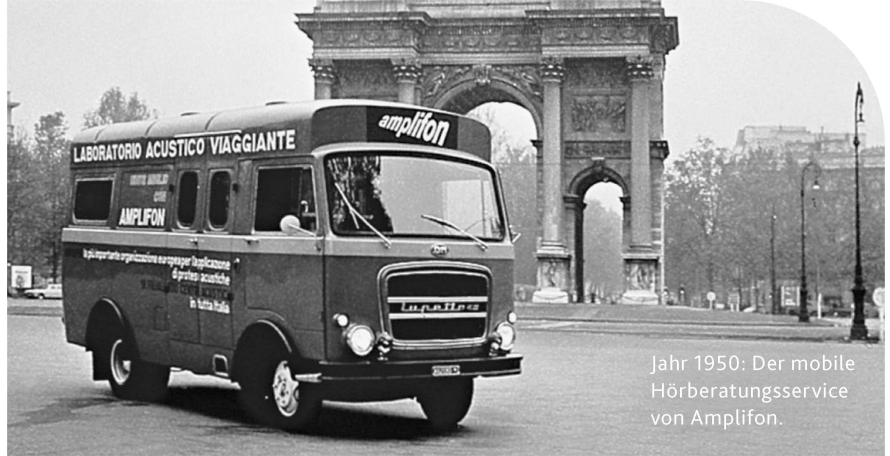
Jahr 1950: Der mobile Hörberatungsservice von Amplifon.