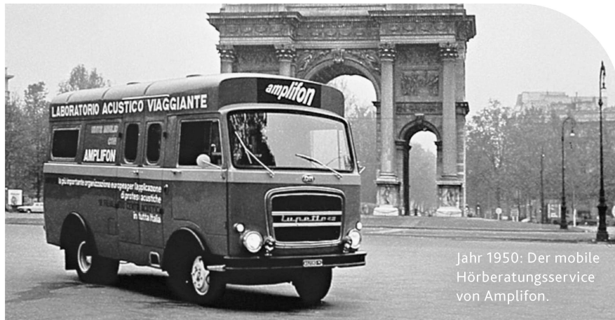
Jahr 1950: Der mobile Hörberatungsservice von Amplifon.