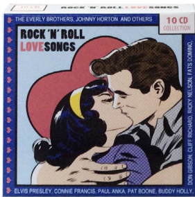
Rock 'n' Roll Love Songs 10-CD-Box Leserpreis CHF 29.–.

Mit den erfolgreichen Shows «Riverdance» und «Lord Of The Dance» ist die irische Volksmusik noch populärer geworden. Die 4-CD-Box «Celtic Woman» entführt Sie in diese einzigartige Atmosphäre der traditionellen und modernen keltischen Musik. Die besten irischen Sängerinnen bieten auf diesen 4 CDs einen faszinierenden Querschnitt durch die Vielfalt dieser grandiosen Musik.