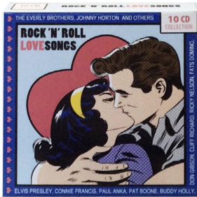
Rock 'n' Roll Love Songs 10-CD-Box Leserpreis CHF 29.–.

Mit den erfolgreichen Shows «Riverdance» und «Lord Of The Dance» ist die irische Volksmusik noch populärer geworden. Die 4-CD-Box «Celtic Woman» entführt Sie in diese einzigartige Atmosphäre der traditionellen und modernen keltischen Musik. Die besten irischen Sängerinnen bieten auf diesen 4 CDs einen faszinierenden Querschnitt durch die Vielfalt dieser grandiosen Musik.