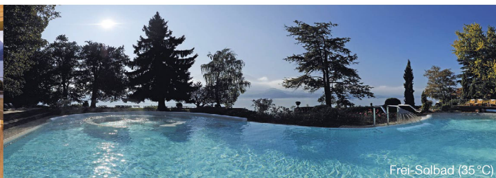
Frei-Solbad (35 °C)