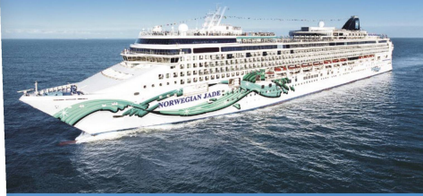
Ihr Schiff: Norwegian Jade****

Die Norwegian Jade überzeugt mit einer grosszügigen abwechslungsreichen Infrastruktur Gäste jeden Alters. 2 Schwimmbäder, Fitnesscenter, Wellnessbereich. Premium All Inclusive bedeutet: Vollpension inkl. reicher Getränkeauswahl in den meisten Restaurants und Bars; spektakuläre Unterhaltung und Trinkgelder an Bord sind bereits im Reisepreis inbegriffen.