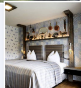
Träumerei #8 Boutique Hotel