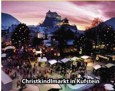
Christkindlmarkt in Kufstein

Das wunderschöne Städtchen Kufstein mit seiner bekannten Festung ist vielbesungen und