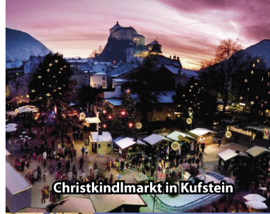
Christkindlmarkt in Kufstein

Das wunderschöne Städtchen Kufstein mit seiner bekannten Festung ist vielbesungen und