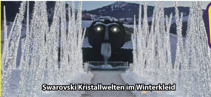
Swarovski Kristallwelten im Winterkleid