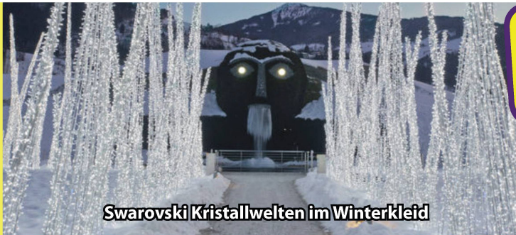
Swarovski Kristallwelten im Winterkleid