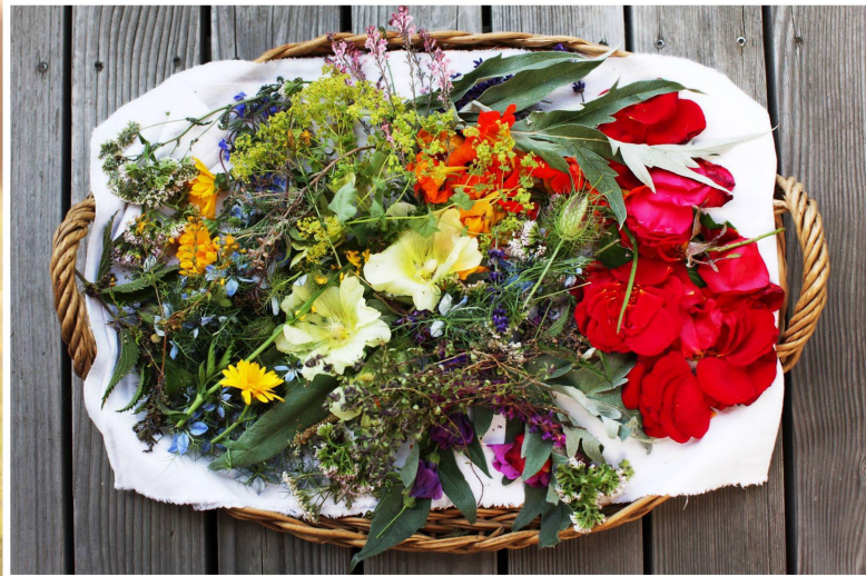
Ein bunter Strauss Gesundheit: Lisetta Loretz Cramerli stellt farbenfrohe Kombinationen zusammen, die auch kleine Naturheiler sind.