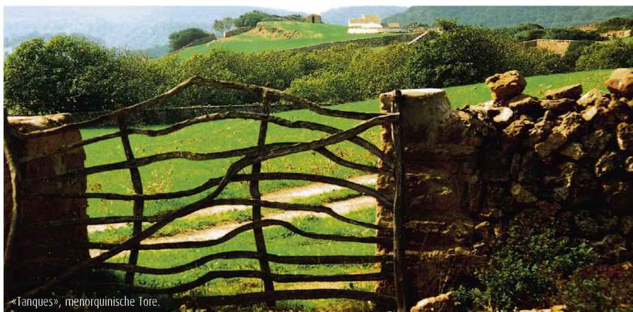
«Tanques», menorquinische Tore.

Wir fahren nach Ciutadella, der ehemaligen In-