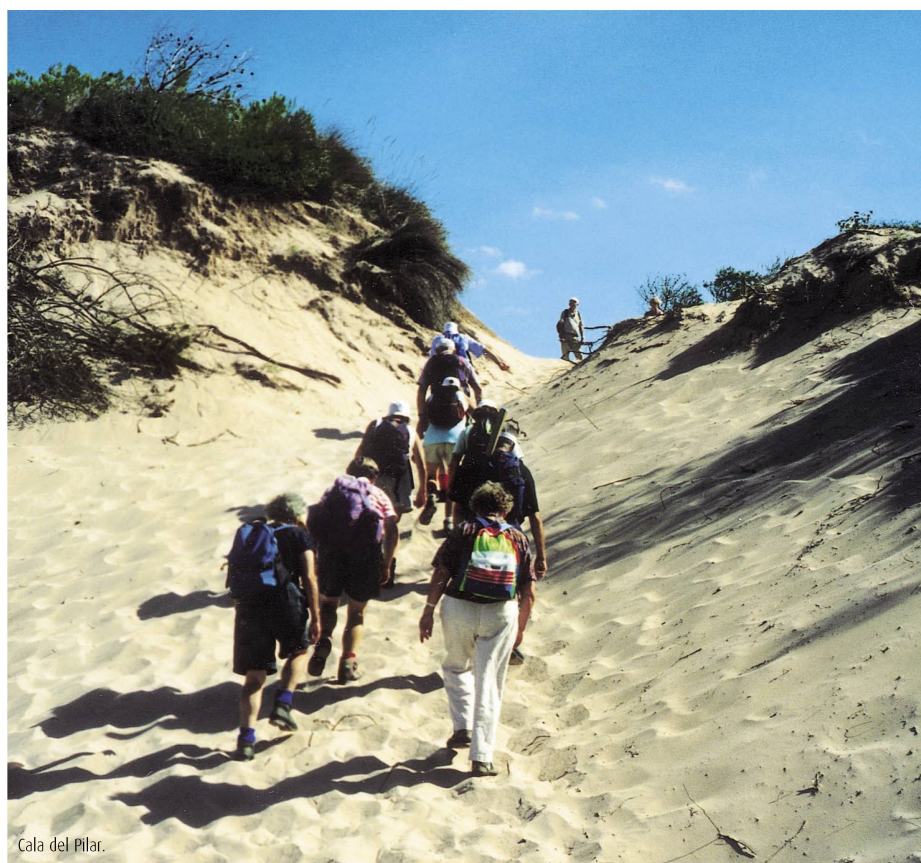
Cala del Pilar.

Gemeinsam besichtigen wir die Hauptstadt Mahón mit dem schönen Fisch- und Gemüsemarkt. Wenn es das Wetter erlaubt, unternehmen wir eine interessante Hafenrundfahrt. In einem typischen Restaurant auf dem Lande geniessen wir das Mittagessen und besuchen anschliessend die gut erhaltenen Ausgrabungen von Torralba.