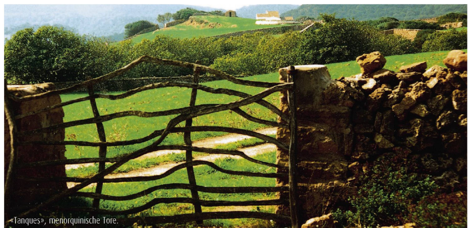
«Tanques», menorquinische Tore.

Wir fahren nach Ciutadella, der ehemaligen In-