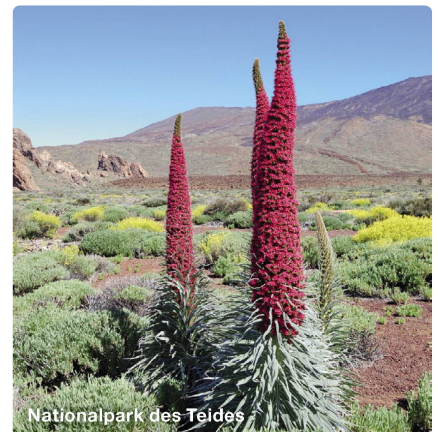
Nationalpark des Teides