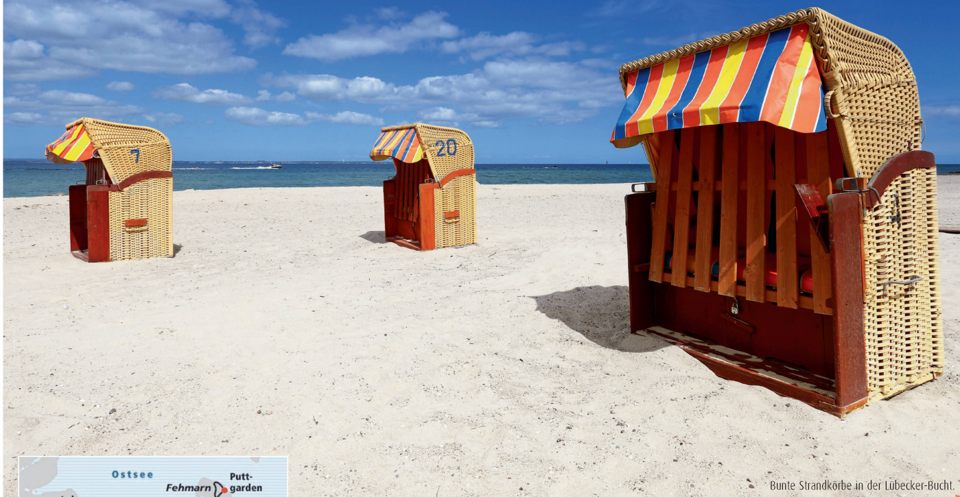
Bunte Strandkörbe in der Lübecker-Bucht.