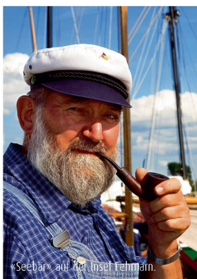
«Seebar» auf der Insel Fehmarn.