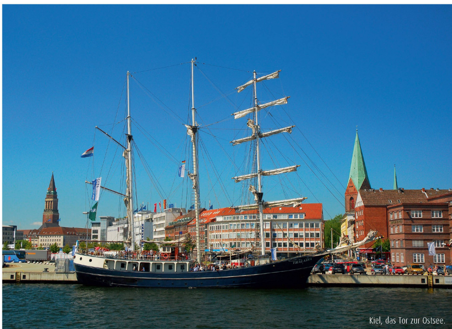
Kiel, das Tor zur Ostsee.