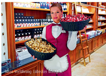
Süsse Verführung: Lübecker Marzipan

5-Seen-Fahrt und Bummel durch die Rosenstadt Eutin, dem «Weimar des Nordens».