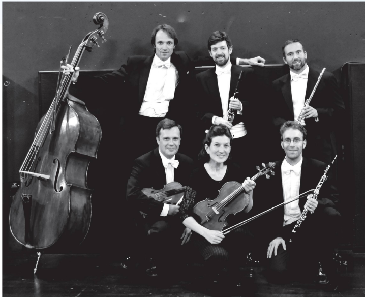
Tanz in der Kammer: An der Kramgasse wartet ein musikalisches Vergnügen.