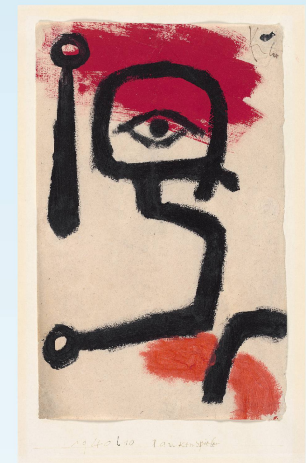
Paul Klee, Paukenspieler, 1940, 270, Kleisterfarbe auf Papier auf Karton 34,6 x 21,2 cm, Zentrum Paul Klee, Bern

Nach seinem Tod hinterliess der in Münchenbuchsee geborene Maler und Grafiker ein überaus vielseitiges Werk, das dem Expressionismus, Konstruktivismus, Kubismus, Primitivismus und dem Surrealismus zugeordnet wird.