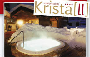
(Einlösbar von So bis Fr)

1 × 2 Nächte für 2 Personen im Verwöhnhotel Kristall im Wert von ca. CHF 750.–!