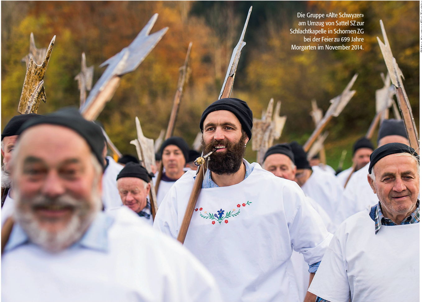
Die Gruppe «Alte Schwyzer» am Umzug von Sattel SZ zur Schlachtkapelle in Schornen ZG bei der Feier zu 699 Jahre Morgarten im November 2014.