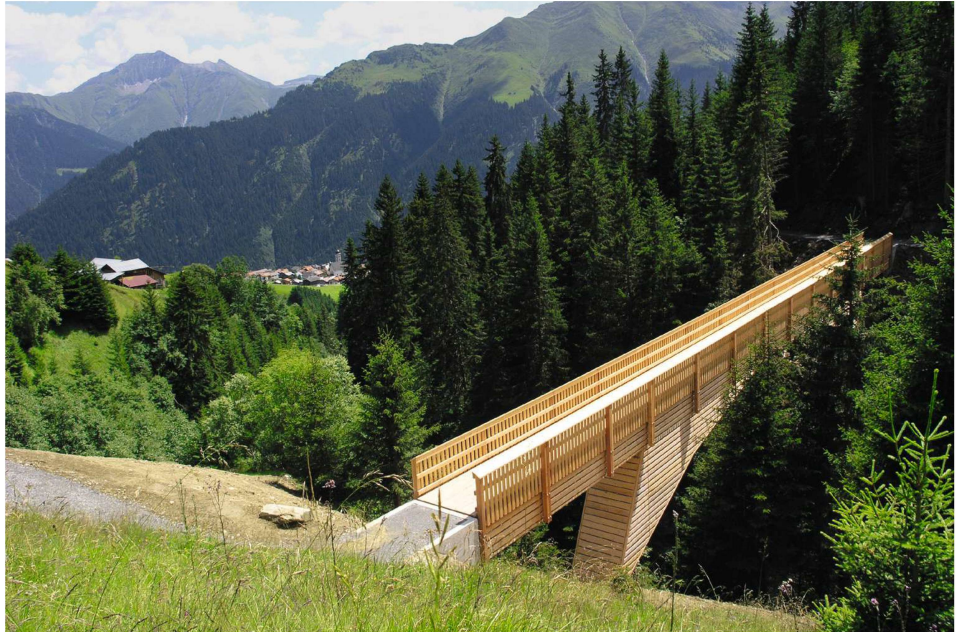
Auf der Wanderung von Lumbrein nach Nussaus quert man die schöne 56 Meter lange Holzbrücke.