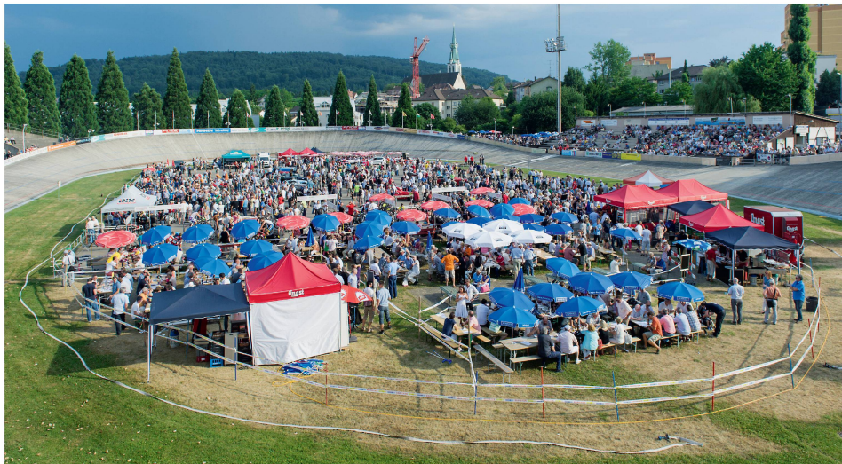
Grosse Namen auf den Boliden und eine noch grössere Begeisterung bei Gross und Klein: Im Betonring von Oerlikon trifft sich ein verschworener Kreis von Motorsportfans zu gemeinsamem Staunen und Fachsimpeln.

Die Motoren knattern und heulen, es riecht nach Rizinusöl, mit dem die Besitzer ihre geliebten Oldtimer vor dem Rost schützen. Dann wieder weht einem der Duft von Grilliertem um die Nase, während man für ein Bier ansteht. Wo sonst nur eingefleischte Fans von Velorennen hinpilgern, steigt am Dienstag, 21. Juli, wieder ein Volksfest.