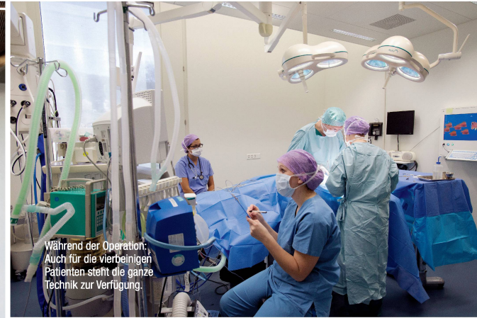
Während der Operation: Auch für die vierbeinigen Patienten steht die ganze Technik zur Verfügung.