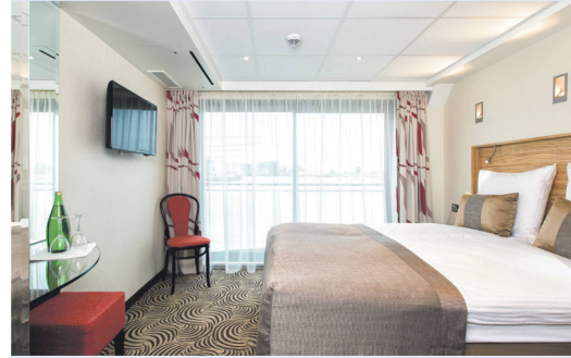
2-Bettkabine Mittel-/Oberdeck mit französischem Balkon

Rabatt von Fr. 200.- bereits abgezogen, Hauptdeck hinten