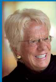
Carla Del Ponte