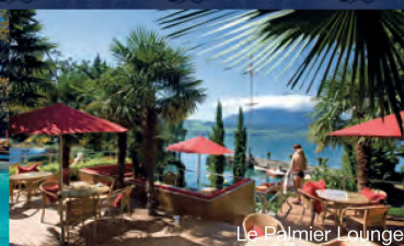
Le Palmier Lounge