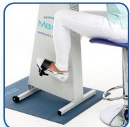
Nur Beine bewegen