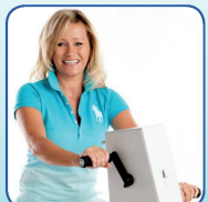
Nur Arme bewegen