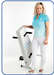
Einfach und leicht zu transportieren

Hält Sie aktiv, fit und beweglich bis ins hohe Alter Schont Gelenke und Knochen – ohne Sturzgefahr Seit 20 Jahren erprobt von Senioren und Reha Kunden