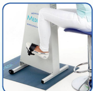
Nur Beine bewegen