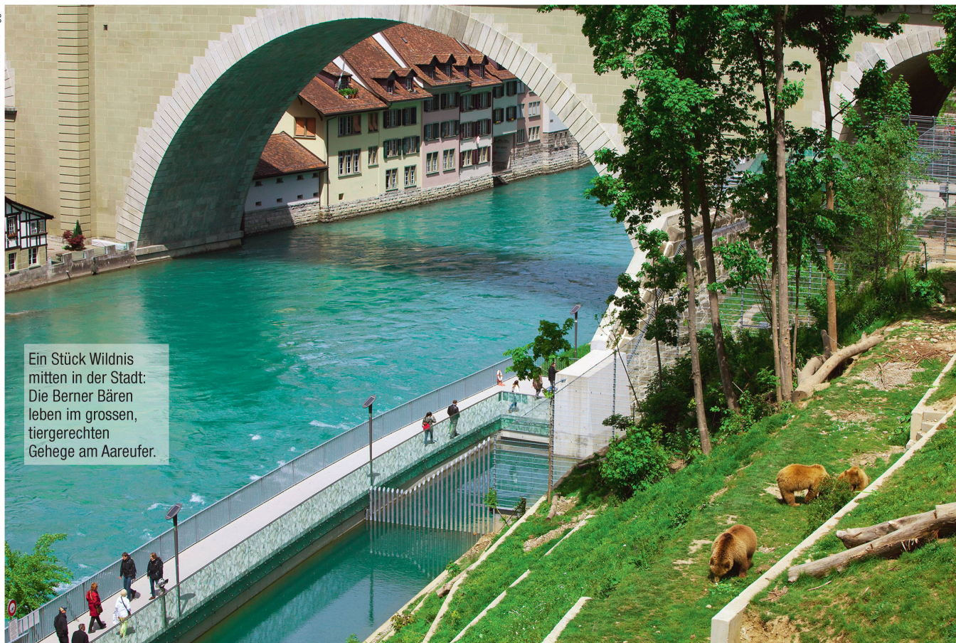
Ein Stück Wildnis mitten in der Stadt: Die Berner Bären leben im grossen, tiergerechten Gehege am Aareufer.