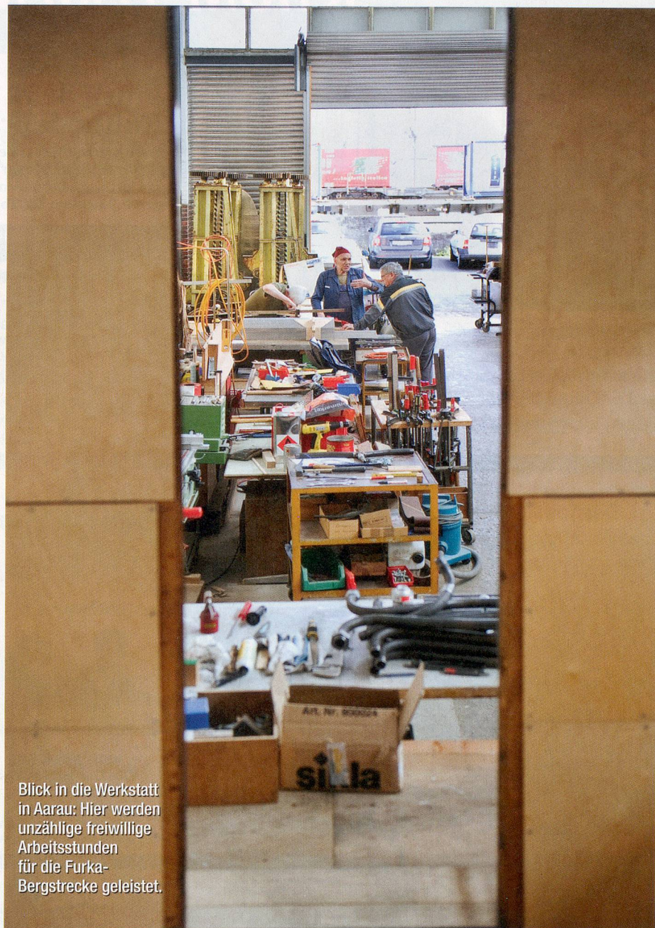
Blick in die Werkstatt in Aarau: Hier werden unzählige freiwillige Arbeitsstunden für die Furka-Bergstrecke geleistet.

Alle Informationen über den Verein Furka-Bergstrecke sowie die Sektion Aargau finden Sie im Internet unter www.dfb.ch (hier können für die Bahnfahrten auch Sitzplätze reserviert werden). Weitere Bilder finden Sie unter www.zeitlupe.ch