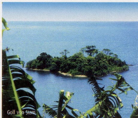
Golf von Siam