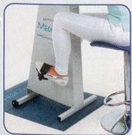
Nur Beine bewegen