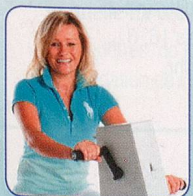
Nur Arme bewegen