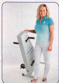
Einfach und leicht zu transportieren

Hält Sie aktiv, fit und beweglich bis ins hohe Alter Schont Gelenke und Knochen – ohne Sturzgefahr Seit 20 Jahren erprobt von Senioren und Reha Kunden