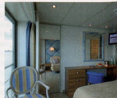
2-Bettkabine Deluxe Oberdeck mit franz. Balkon

Preise p.P. in Fr. (vor Rabatt) Mitteldeck vorn 1590.– / Oberdeck Deluxe 2090.–