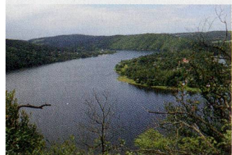
Flusslandschaft Obere Moldau

Ausflug im Ausflugspaket (Fr. 255.–) enthalten | Auftragspauschale Fr. 35.– | Details und Zuschläge siehe www.thurgautravel.ch oder Katalog