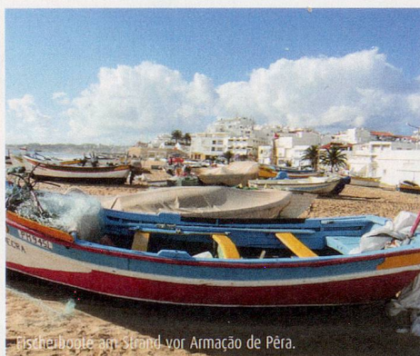
Fischerboote am Strand vor Armação de Pêra.

Montag: > Wanderzeit: ca. 1 ½ Std. und 1 – 1 ¼ Std. Am Vormittag unternehmen wir eine Rundwanderung zwischen den Flüssen Odelouca und Arade durch Orangenhaine und entlang einer Levada. Anschliessend besuchen wir Silves, die einstige Hauptstadt des Maurenreiches Al-Gharb, heute ein kleines, aber sehr reizvolles Landstädtchen. Den Tag runden wir mit einem gemütlichen Strandspaziergang bei Armação de Pêra ab.