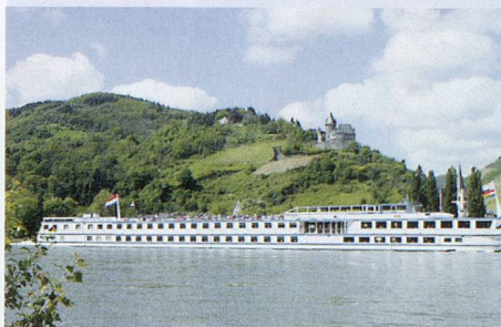
4**** Boutiqueschiff MS Rembrandt van Rijn

Es het solangs het Rabatt* bis Fr. 500.–