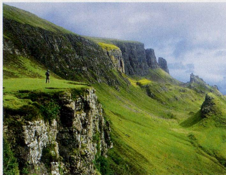
Schottlands ebenso schroffe wie sanfte Landschaften und seine pittoresken Dörfer faszinieren immer neu.

Auf der nostalgischen Fahrt mit der Strathspey-Dampfbahn fahren Sie den River Spey entlang und vorbei am Naturschutzgebiet Boat of Garten. Weiter geht es dann per Bus auf dem berühmten Malt Whisky Trail. Besuch einer der zahlreichen Whisky-Brennereien in der malerischen Speyside. Führung und Kostprobe des «Water of Life», des Lebenswassers.