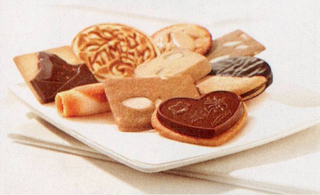
Jede Feingebäck-Spezialität von Kambly ist einzigartig und eine Persönlichkeit.

Es sind besondere Momente, an die wir uns alle gerne erinnern: mit der Mutter feine Guetzli backen, mit den Kindern etwas Neues ausprobieren, seine Lieben und sich selbst mit etwas Feinem überraschen, sich freuen und