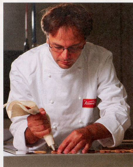
Die einzigartigen Kambly Feingebäck Kreationen werden liebevoll hergestellt – wie von des «Maître Chocolatier et Pâtissier» Meisterhand.

der Dankbarkeit und des Respekts vor den Gaben der Natur. Echt Gutes und Schönes will von Herzen kommen.