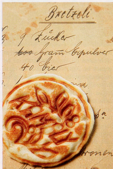
Die Kambly Bretzeli werden nach dem gleichen Rezept und mit derselben Sorgfalt wie vor hundert Jahren gebacken.