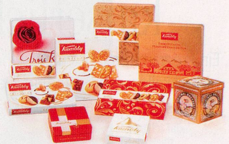
Die Freude, Freude zu bereiten, kennt keine Grenzen und spricht jede Sprache.

Was gibt es Schöneres, als etwas Feines und Edles zu schenken? Ein kleines Dankeschön, eine liebevolle Überraschung, ein Zeichen der Freundschaft. Zum Beispiel mit einer Kollektion meisterhaft kreierten Kambly Feingebäcks.