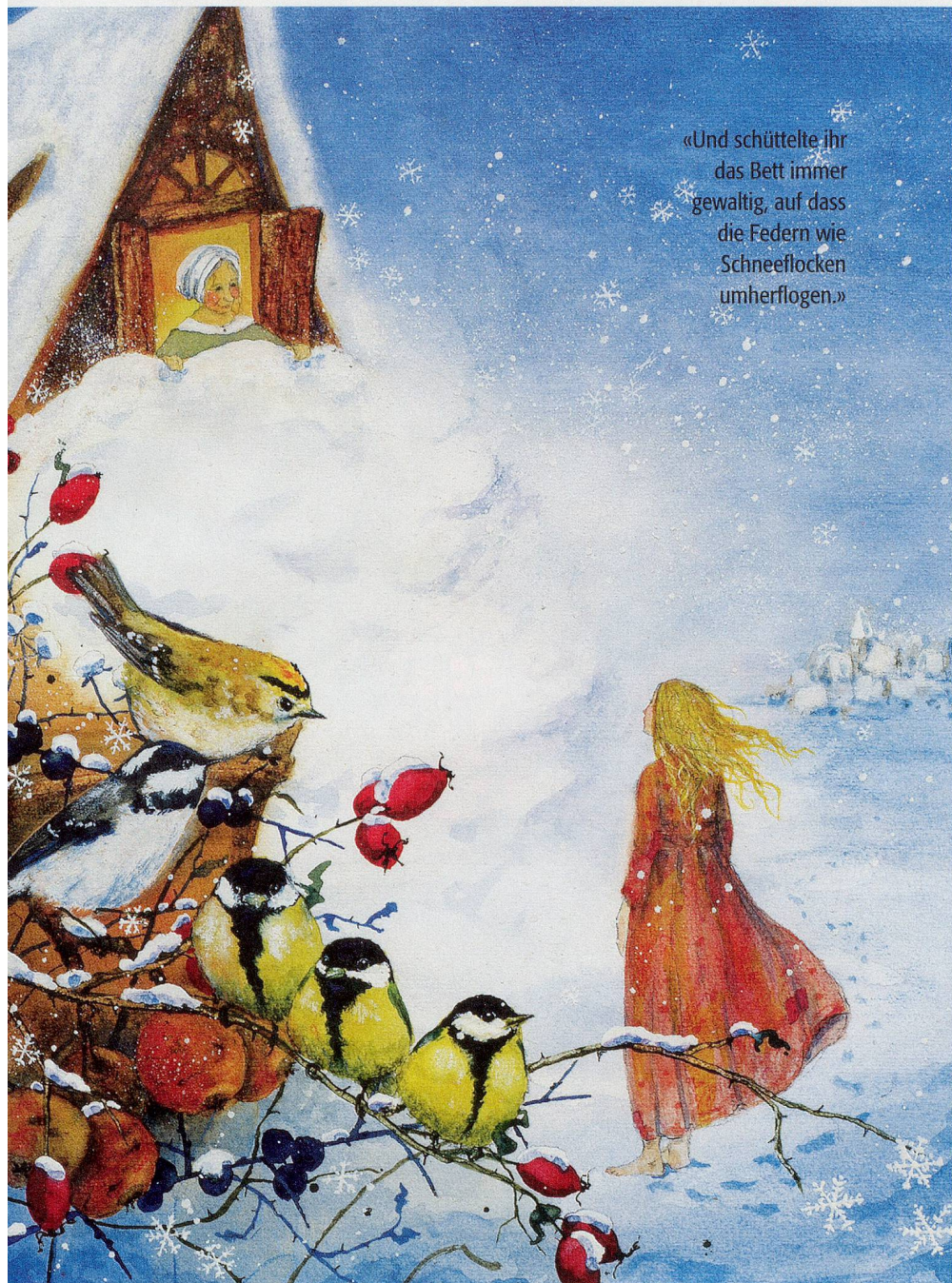
Illustration: Daniela Drescher, Verlag Urachhaus

«Und schüttelte ihr das Bett immer gewaltig, auf dass die Federn wie Schneeflocken umherflogen.»