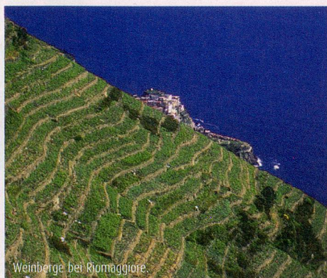
Weinberge bei Riomaggiore.

Montag: > WZ: ca. 3½ Std. ▲ 460 m ▼ 520 m Unsere Wanderung führt uns über den Pilgerweg zur Madonna di Soviore. Durch Macchia wandern wir weiter zur Madonna di Reggio und über den alten Pilgerweg hinunter nach Vernazza, ins Nachbardorf von Monterosso.