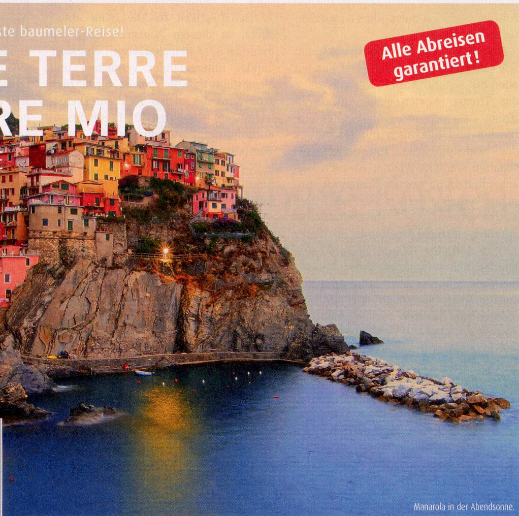
Manarola in der Abendsonne.

Monterosso, Vernazza, Corniglia, Manarola, Riomaggiore – schon die Namen der ans Meer, teils auf Felsvorsprüngen über dem Meer gebauten Dörfer klingen wie Musik. Dort, wo wir unterwegs sind, finden wir noch ein Stück unverfälschtes Italien. Hier mit weitem Ausblick aufs Meer einen Fuss vor den anderen zu setzen oder im Schatten einer Pergola zu schlemmen, verspricht Entspannung, Erholung und echten Feriengenuss. Schon viele langjährige Freundschaften haben im Kreis der Baumis am bezaubernden Küstenstreifen der Cinque Terre begonnen!