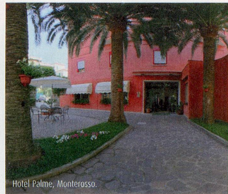
Hotel Palme, Monterosso.