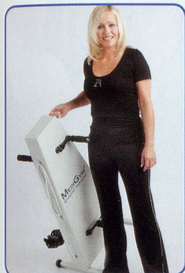
Einfach und leicht zu transportieren

Hält Sie aktiv, fit und beweglich bis ins hohe Alter Schont Gelenke und Knochen – ohne Sturzgefahr Seit 20 Jahren erprobt von Senioren und Reha Kunden