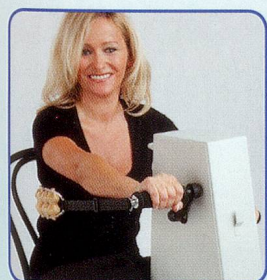
Nur Arme bewegen