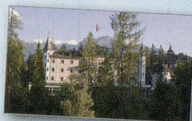
SCHWEIZERHOF FLIMS ROMANTIKHOTEL

Schweizerhof Flims, Romantikhof – klein, fein, persönlich – ein familiengeführtes Jugendstilhaus in den Bündner Alpen. Geniessen Sie 2 Übernachtungen für 2 Personen im Doppelzimmer, inkl. 5-Gang-Abendmenü. Gültig bis 15. Oktober 2013 und im Sommer inkl. Bergbahnabonnement. www.schweizerhof-flims.ch