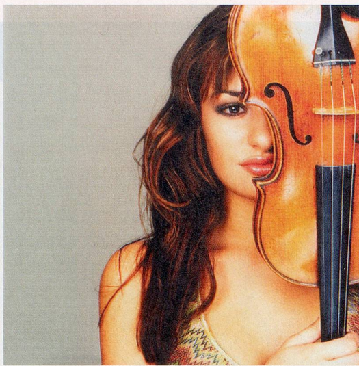
Nicola Benedetti kommt als Solistin in die Zürcher Tonhalle.