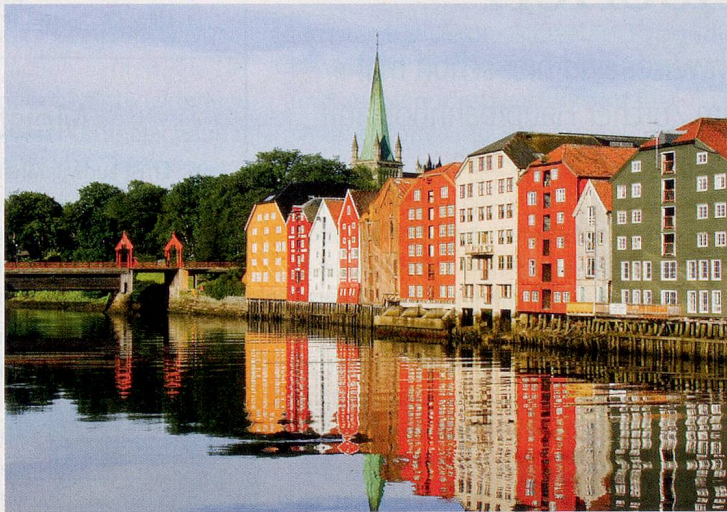
Vieles gibts auf der Hurtigruten zu entdecken – von verträumten Fjorden über die Faszination des Nordlichts bis zu den malerischen Städtchen entlang der Route.