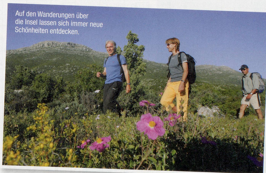
Auf den Wanderungen über die Insel lassen sich immer neue Schönheiten entdecken.

Samstag: Transfer zum Flughafen und Rückflug in die Schweiz oder individuelle Verlängerungswoche.