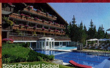
Sport-Pool und Solbad