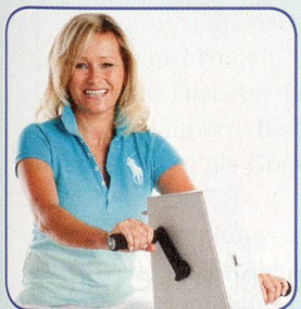
Nur Arme bewegen