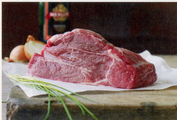
60 Siedfleisch ist ein besonderer Leckerbissen. Wer genug Geduld hat, bekommt eine kräftige Sache.