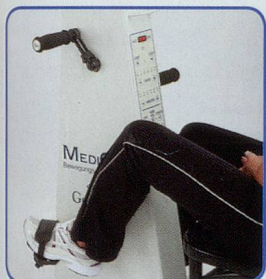
Nur Beine bewegen