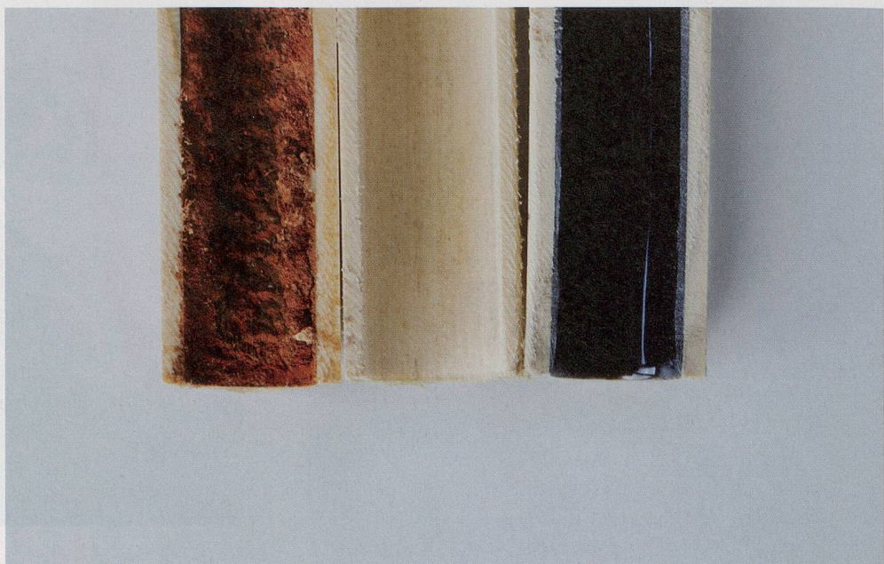
Heizrohr: vor, während und nach der Sanierung

Verfahren, bei denen eine Fussbodenheizung mit hohem Druck durchgespült und so von Schmutz und