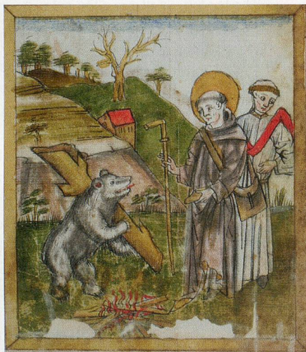
Gallus wird auf dieser alten Darstellung sogar von einem Bären mit Baumaterial unterstützt.