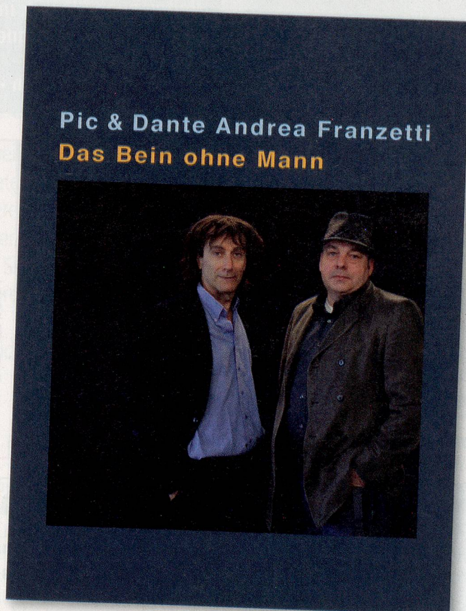
Pic & Dante Andrea Franzetti: «Das Bein ohne Mann», Lenos-Verlag, Basel 2011, 178 Seiten, ca. CHF 29.80.

immer wieder die eigenen Gedanken in Gang. Mehr braucht ein Buch eigentlich nicht zu leisten. hzb