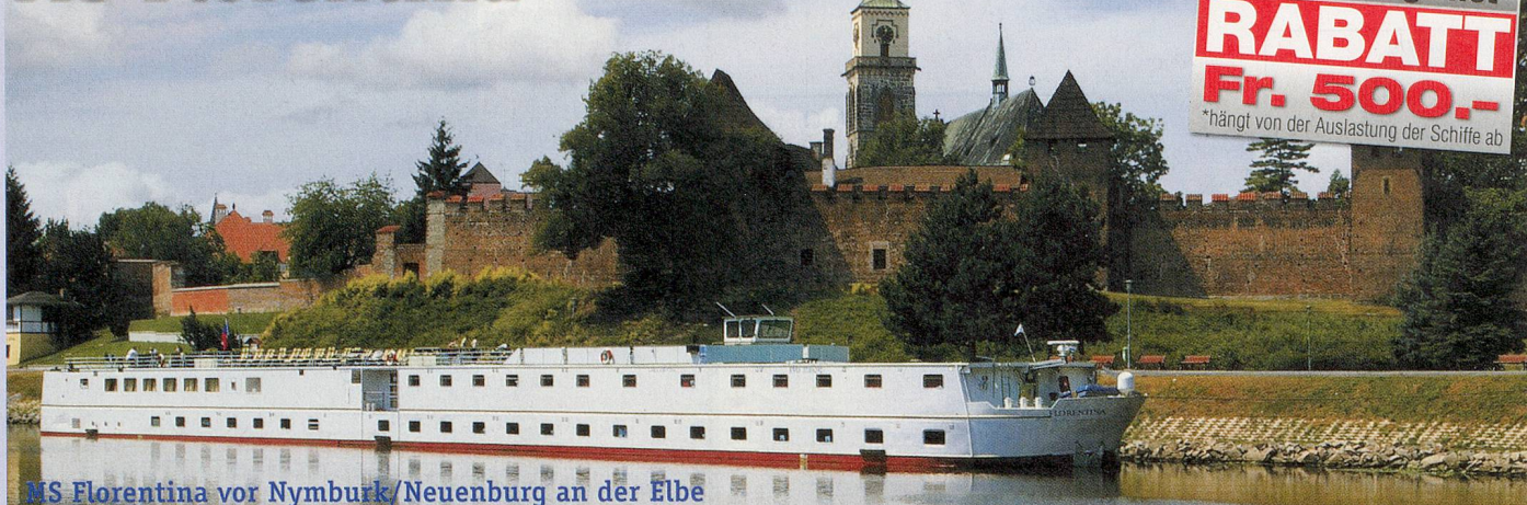
MS Florentina vor Nymburk/Neuenburg an der Elbe

Es het solangs het* RABATT Fr. 500.- *hängt von der Auslastung der Schiffe ab