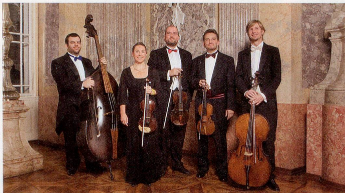
Das Concilium musicum Wien begeisterte mit seinem Konzert im bis auf den letzten Platz gefüllten Fraumünster.