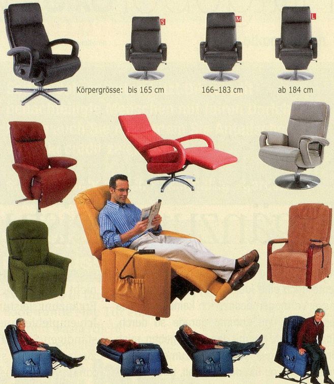
Körpergrösse: bis 165 cm 166–183 cm ab 184 cm

• Grosse Auswahl • Eigener Showroom • Heimservice ganze Schweiz Mehr unter www.rentschsitzgut.ch oder Prospekt anfordern