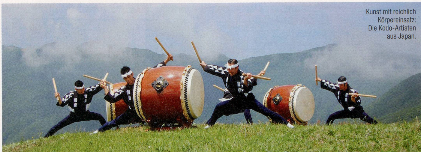
Kunst mit reichlich Körpereinsatz: Die Kodo-Artisten aus Japan.