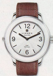
Classic 01 CHF 495.-