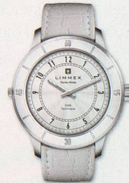
Serenade 01 CHF 575.-