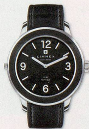
Classic 02 CHF 495.-